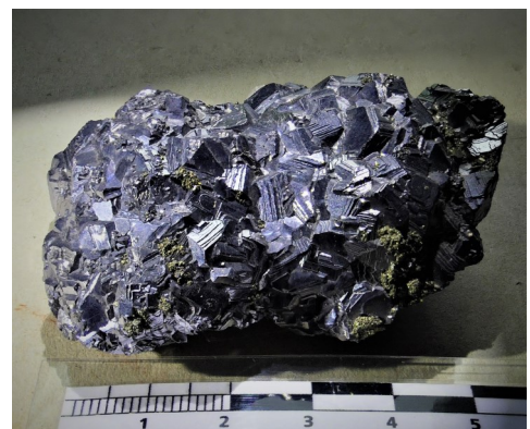
Bleiglanz mit Pyrit